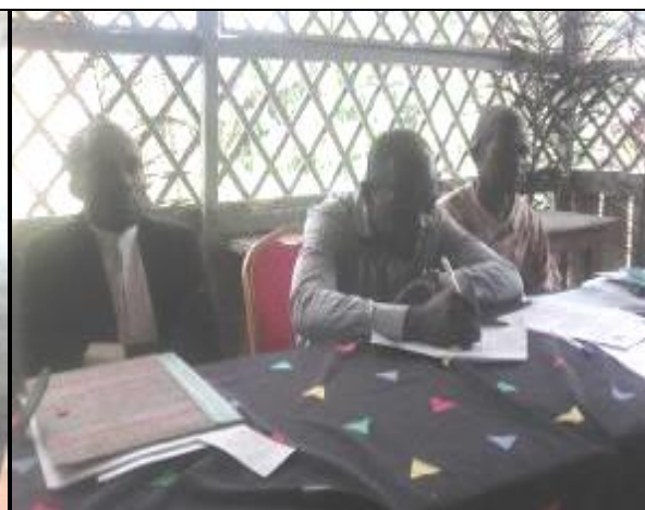
Des membres du bureau exécutif de l'OFERA participant activement à la séance de travail.