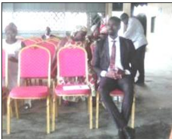
Intervention du DASDRH du CADDE, ci au premier plan.