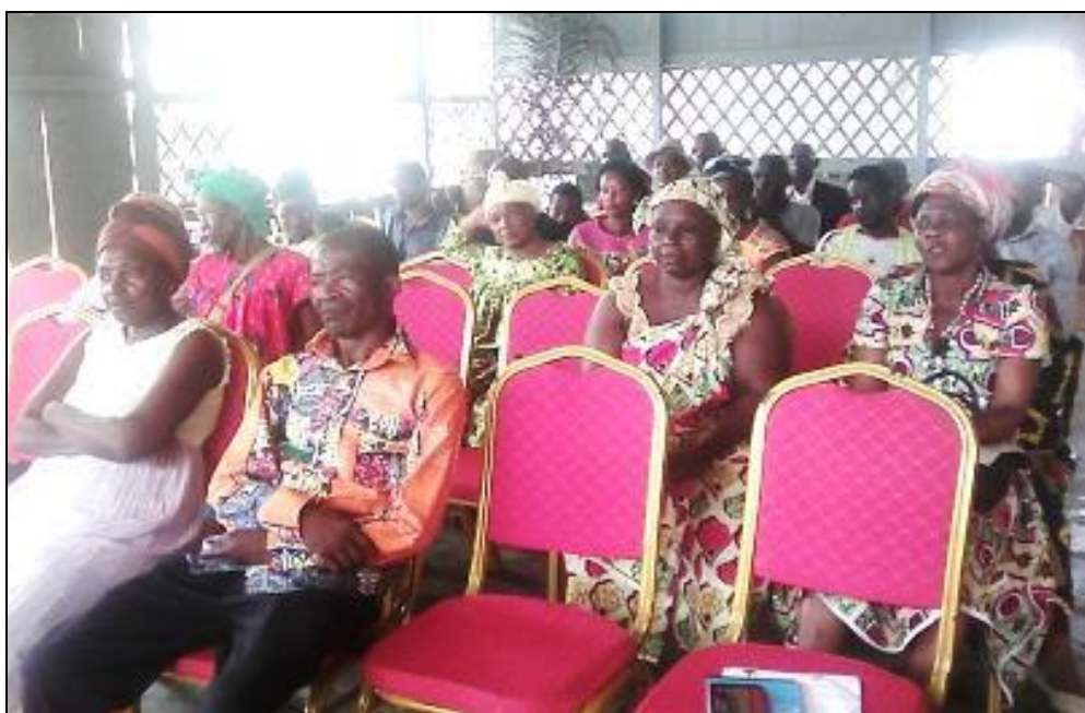
Photo 3. L'attitude attentive des participants

Les membres de l'OFERA ont l'honneur de commencer, et les deux membres de la délégation du CADDE s'introduisent également. Après cette articulation de la cérémonie, la tribune revient au Directeur Exécutif du CADDE. Celui-ci présente la convention de partenariat entre le CADDE et l'OFERA.