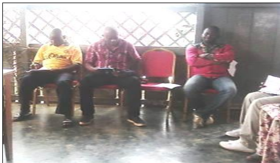
Photo 2 : La présence remarquable du Chef de poste des forêts et de la faune et les responsables des forces de maintien de l'ordre de sécurité d'Akom II