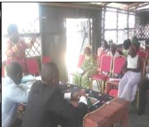
La Présidente de l'OFERA, expliquant en langue locale le contenu de la convention.