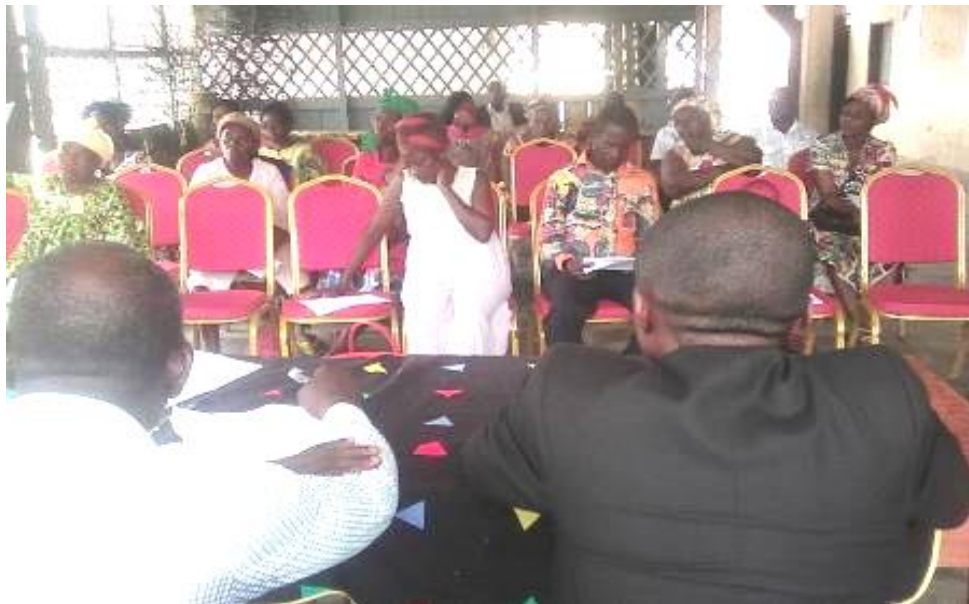
Photos 1 et 2 : Ambiance de concertation au début de la cérémonie officielle de signature de la convention de partenariat entre le CADDE et l'OFERA