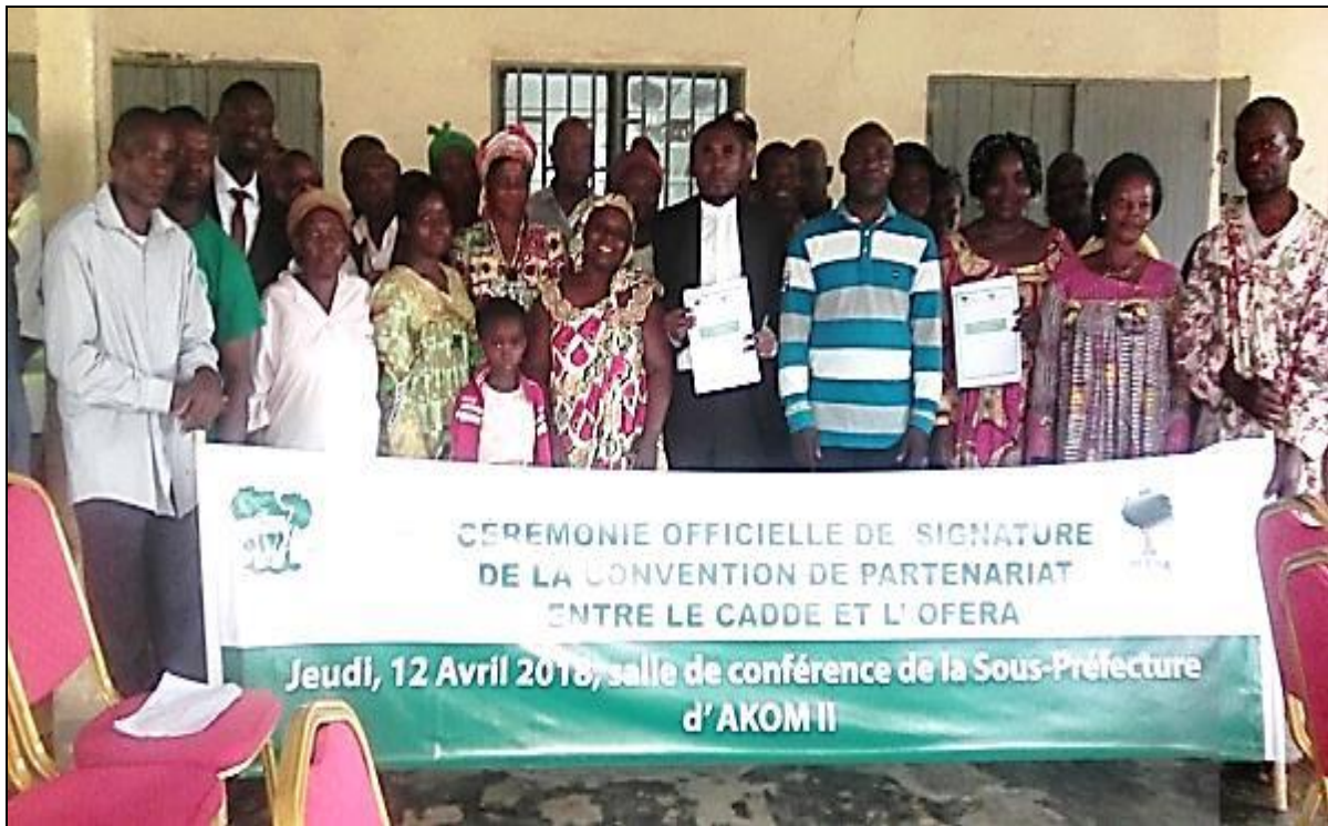
Photo 6. Photo de famille de la cérémonie de signature de la convention de partenariat entre le CADDE et l'OFERA

Après la photo de famille, M. le Sous-Préfet, M. le Secrétaire Général de la mairie d'Akom II et les autres autorités de l'arrondissement retournent à leurs occupations respectives. La journée se poursuit à partir de ce moment par une séance de travail entre les membres du CADDE et de l'OFERA.