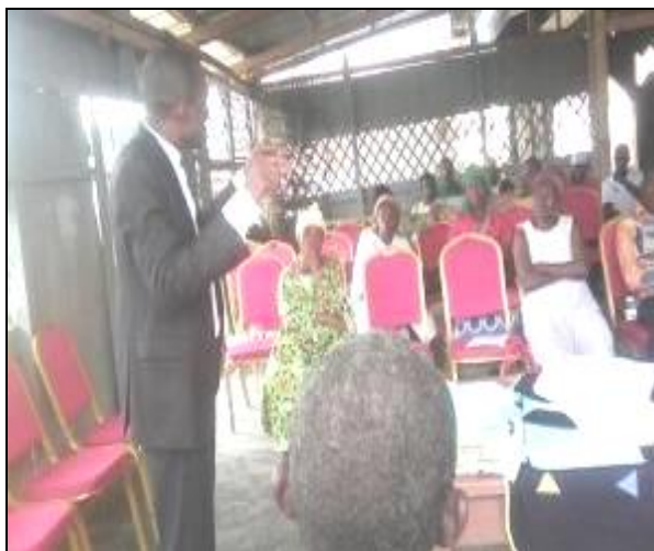
Le Directeur Exécutif du CADDE détaillant les termes de la convention.