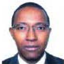
Abdoul MBAYE Président Administrateur Directeur Général de la Banque Sénégalo Tunisienne (BST)