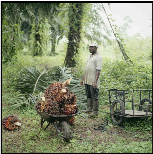
Photographie 4

Ce mécanisme de soutien appliqué dès la création de l'entreprise agro-industrielle avait favorisé la création de plusieurs milliers d'hectares de palmeraies villageoises qui ont constitué pendant longtemps une force économique importante des localités riveraines des plantations industrielles. Grâce à ce dispositif, les petits planteurs voyaient les coûts de transport et la pénibilité associée à cette tâche minimisés, tandis qu'ils retiraient des revenus suffisamment intéressants pour pouvoir subvenir à leurs besoins.