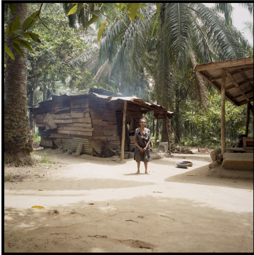
Photographie 3

Le quartier de Mbonjo a été complètement rasé ; il ne reste que deux maisons qui sont désormais ceinturées de palmiers.