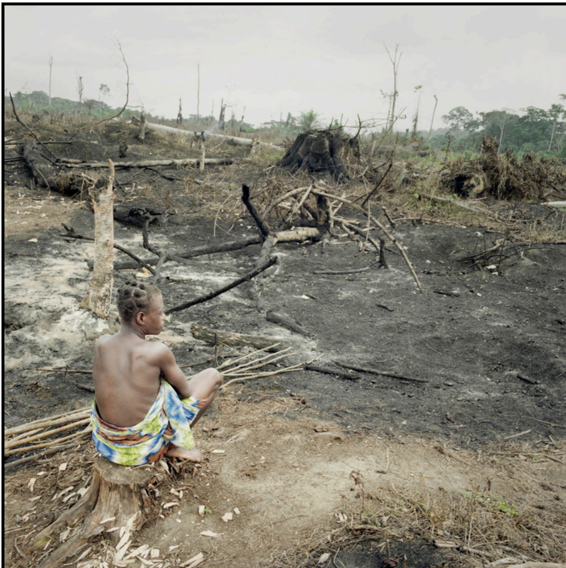
Photographie 1