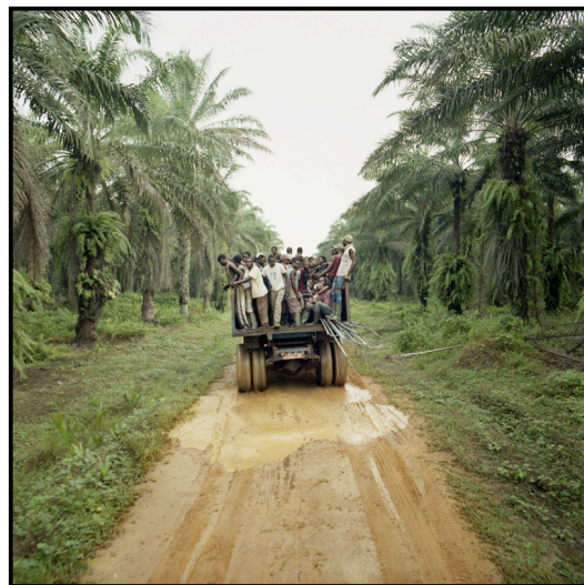
Photographie 6- © Isabelle Alexandra Ricq

Les conditions de transport des ouvriers de la plantation constituent sans nul doute l'illustration la plus criante du mépris affiché par la SOCAPALM pour les règles de sécurité : ainsi, pour se rendre sur les palmeraies au petit matin, les travailleurs sont parqués dans des conteneurs conçus pour transporter de la marchandise ; entassés comme du bétail avec leurs outils de travail, il arrive fréquemment que les ouvriers se blessent. Le soir venu, ils doivent marcher sur plusieurs kilomètres pour rentrer dans leurs campements situés au cœur des plantations.