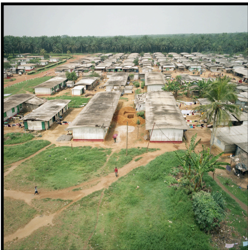
Photographie 7

Les travailleurs de la SOCAPALM sont hébergés avec leur famille dans des campements qui se situent au cœur des